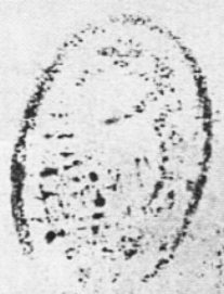
الصفحة الأخيرة من مخطوطة كتاب الألفات

على ذلك وعلى ما ذكرنا ونيس عليه نصيب ان شاء الله وبالله تعالى وتعالى ان شاء الله وتعالى وتعالى وتعالى وتعالى ذكر حرب المعجم وصل الالف على جميعها فالالف في عمرو بن العاص في الفقه الفقهيات على اي اسم من اسماء بني الحنظلة بالقسمة في عهد نعيم احمد بن خالد فلاننا سالم بن الفضل بن ابي عبد الله بن احمد بن ابي احمد بن موسى بن ابي عبد الله بن ابي عبد الله بن احمد بن ابي المودب قال اخبرنا احمد بن محمد بن ابي جابر قال حدثنا المعطالي قال نا عبد الله بن سعيد قال الفقه انما عرف حرب المعجم على الرضا بن تبارك استعمله وتطاولت فيه وهو تسعة وعشرون حرفا جتواضع الالف من بيضا فيشتر الالف له تواضع يجعله فليما امام كل اسم من اسماء الحسيني وقال يستعمل بن عبد الله العشي ان الالف حرب سجدت له الحروب لكرامة على الله عز وجل والحمد لله رب العالمين وصل الله على سيدنا محمد الطيب وهو الله وسلم وكان الالف في يوم السبت يوم العاشر الاوكل في سنة الحجة التي من عام ثلث وخمسين هـ تمام في ما بين علي بن رضاه عبيد الله محمد بن محمد بن علي بن المقدم حقيقته لنفسه ثم لغيره الله من سنة هـ الله كل من فراه ونسبته او من اصله شيئا من امزاج والحمد لله رب العالمين وصل الله على سيدنا محمد وآله