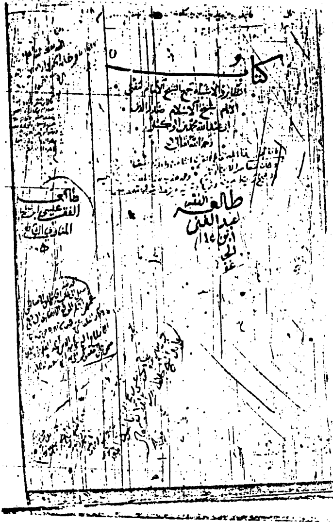
طرة نسخة الجامعة الإسلامية