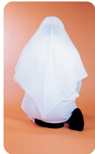
صور الجلوس للتشهد الأول

— أي ركعتين — كصلاة الفجر والجمعة والعيدين جلس بعد رفعه من السجدة الثانية ناصباً رجله اليمنى ، مفترشاً رجله اليسرى ، واضعاً يده اليمنى على فخذه اليمنى ، قابضاً أصابعه كلها إلا السبابة فيشير بها إلى