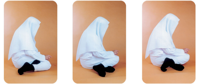
صور الجلوس للتشهد الأخير (التورك)

كالمغرب ، أو رباعية كالظهر والعصر والعشاء قرأ التشهد المذكور آنفاً مع الصلاة على النبي ﷺ ، ثم نهض قائماً معتمداً على ركبتيه ، رافعاً يديه إلى حذو منكبيه أو أذنيه قائلاً : (الله أكبر) ، ويضعهما - أي يديه - على صدره كما تقدم ، ويقرأ الفاتحة فقط وإن قرأ في الثالثة والرابعة من الظهر زيادة عن الفاتحة في بعض الأحيان فلا بأس لثبوت ما يدل على ذلك عن النبي ﷺ من حديث أبي سعيد رضي الله عنه ، ثم يتشهد بعد الثالثة من المغرب وبعد الرابعة من الظهر والعصر والعشاء كما تقدم ذلك في الصلاة الثنائية ، ثم يسلم عن يمينه وشماله .