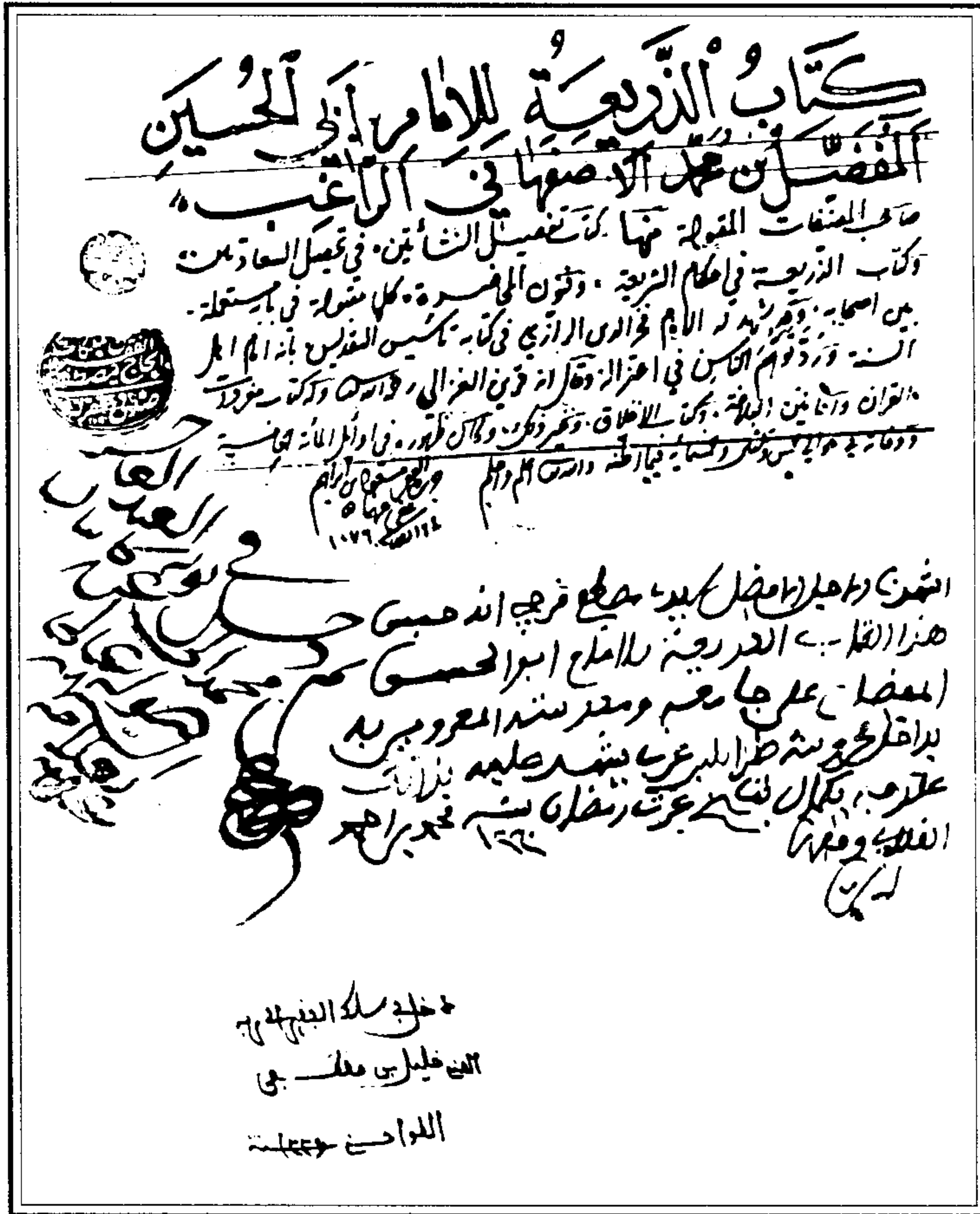
غلاف النسخة « أ »