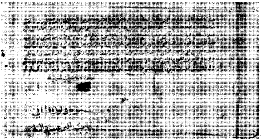
لوحة رقم (١٢) وهي الصفحة الأخيرة من المجلد من النسخة (د)