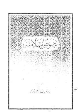
For Personal use Only. Courtesy of Institute of the Language of the Qur'an (www.lqtoronto.com), and by kind permission of Shaykh Dr. V. Abdur Raheem