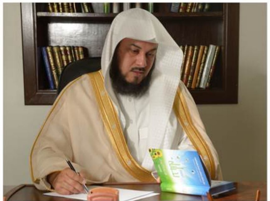
دکتر محمد بن عبدالرحمن العریفی