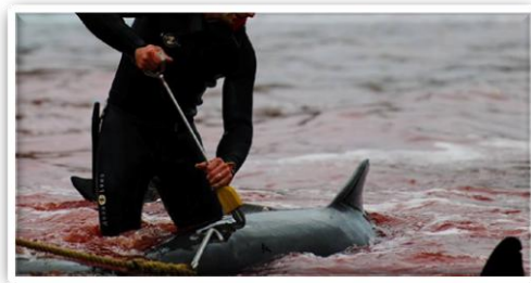
Gerincbevezetés a bálnák számára

Az Európai Unió és az Egyesült Államok egyaránt betiltotta a gerincbe vezetett fémrúd használatát a mészárszékeken, mert ez a módszer nagy szerepet játszott a kerge marha kór elterjedésében azáltal, hogy a gerincbe vezetett cső ugyanis a fertőzött agysejteket elterjeszti az állat testében. Az Egyesült Királyságban 2001-ben tiltották be az eljárást a kerge marha kór elterjesztése miatt.