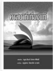
ศาสนาที่เที่ยงแท้