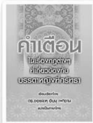
คำเตือนในเรื่องกฎต่างๆ ที่เกี่ยวข้องกับบรรดาหญิง ที่ศรัทธา