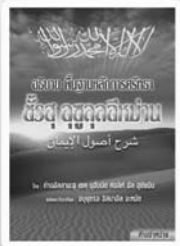
อธิบายพื้นฐาน หลักการศรัทธา ฮัจญ์ อุกุศลุฮ์มาฮ์