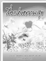
สื่อแห่งความสุข