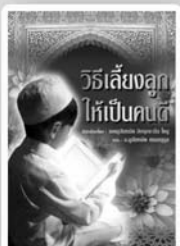
วิธีเลี้ยงลูก ให้เป็นคนดี