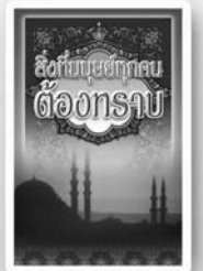
สิ่งกับบุษย์ทุกคน ต้องทราบ