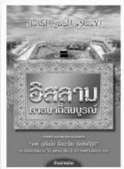
อิสลาม ศาสนาที่สมบูรณ์